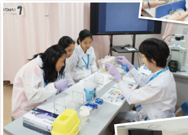
尿の中の細胞について真剣にレクチャーを受けています

毎年恒例となった「キッズセミナー」が、医薬品・医療機器メーカー「アボットジャパン」との共催により、今年も8月に当院で開催されました。市内の中学生20名を対象としたセミナーで行われたのは、トレーニングキットによる採血や、実際に院内で使用している検査装置を用いてのエコー検査など、臨床検査技師の仕事の疑似体験。意外に知られていない臨床検査技師という職業を理解することで、診断や治療方法の決定に大きな役割を担う検査の価値と重要性への理解を深めてもらいました。また、医療を支えるさまざまな職業に目を向けることで、将来のキャリアにも役立てることも目的にしています。普段は受診する立場で訪れる病院で逆の立場になって体験してみると、多くの発見や驚きがあったようです。半日のセミナーを終え閉会式で修了証を手にしたみなさんが、この経験を今後の糧にしてもらえることを願っています。