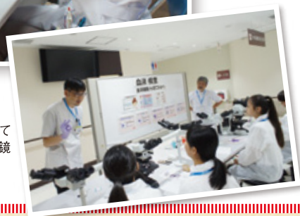
血液の中に流れている細胞を顕微鏡で観察しました