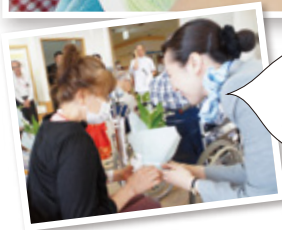
たくさんのしあわせを願っています。