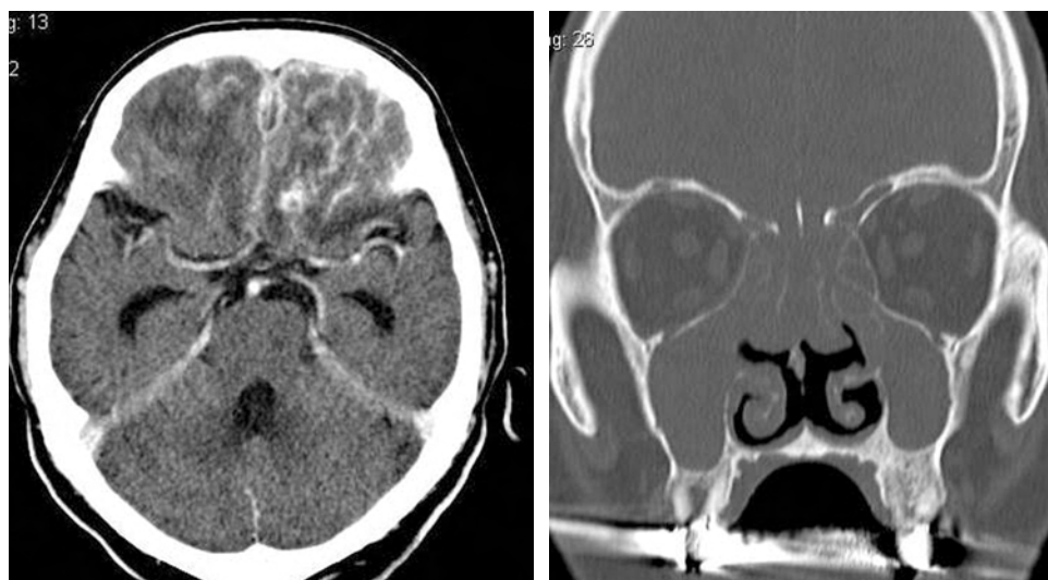
図 2 頭部 CT 検査 前頭葉実質内にリング状の造影効果を疑い, 脳浮腫による低吸収域を広く認める 鼻副鼻腔は骨破壊を伴う軟部陰影を認める

で Ampicillin 6 g/日, Zonisamido, 濃グリセリン・果糖注射液を追加し, 又鼻内所見や画像所見から GPA も考慮して, 入院5日目に PR3-ANCA (以下 C-ANCA), MPO-ANCA を提出した。入院7日目に全身麻酔下で鼻内内視鏡手術による鼻副鼻腔の生検術を行った。手術時は篩骨洞など副鼻腔の骨破壊を認め白色膿汁をともなっていた。鼻副鼻腔数か所から生検を行い, 病理検査に提出した。同日 C-ANCA の結果が 78 (EU) と高値であることが判明した。後日, 病理結果では巨細胞を伴う壊死性の肉芽腫病変で血管炎を疑う所見も認めた。C-ANCA 高値, 鼻内所見とも合わせて GPA と診断した。また, 入院7日目の尿検査では尿潜血土, 尿蛋白土であった。入院13日目に頭部から骨盤の CT を行ったところ肺野に2か所の腫瘤影, 腹部に大動脈瘤を認めた (図 3)。腎病変は認めなかった。頭蓋内病変は著変を認めなかった。入院15日目に脳外科で腰椎穿刺による髄液検査が施行され細胞数 20, 蛋白 103, 糖 63, クロール 127 であり細菌性脳炎は否定的と考えた。同日の頭部造影 MRI で硬膜の肥厚と造影効果を認めたため多発血管炎性肉芽腫による肥厚性硬膜炎と診断した (図 4)。徳島大学呼吸器膠原病内科で治療を行うために入院19日目に転院した。転院後, ステロイドとシクロフォスファミドによる治療を行い, 肺野の腫瘤影や大動脈瘤は縮小傾向となり, 意識レベルも改善を認めた。