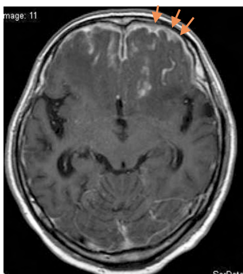
図4 造影MRIで硬膜の肥厚と造影を認めた