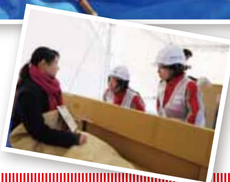
避難所巡回訓練。避難所生活をする被災者一人一人の話を聞きながら、体調を確認しました