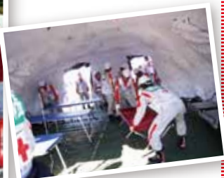
医療救護訓練。大型テント内に、仮設診療所を設置。負傷者にトリアージを実施しました