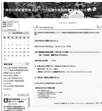
図2 神奈ネットブログ

医学情報サービス研究大会での発表告知用 に、2011年からブログとツイッターを開始し ました。 4,5) 現在は研修会開催のお知らせ等 に利用しています。ツイッターのアカウント は、@kananetlib になります (図2)。