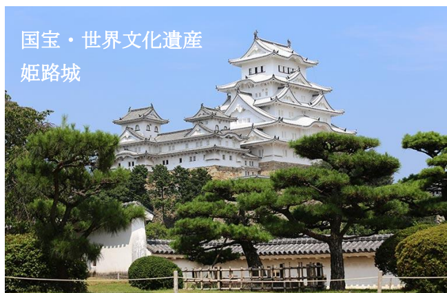
国宝・世界文化遺産 姫路城