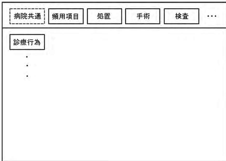
図2 電子カルテ：病院共通の画面