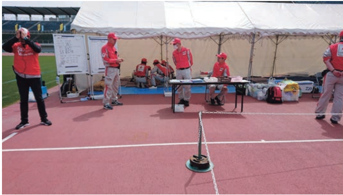
写真1 競技場内ゴール横の救護所での様子