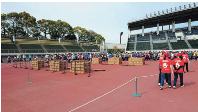
写真2 競技場内ゴール付近の様子