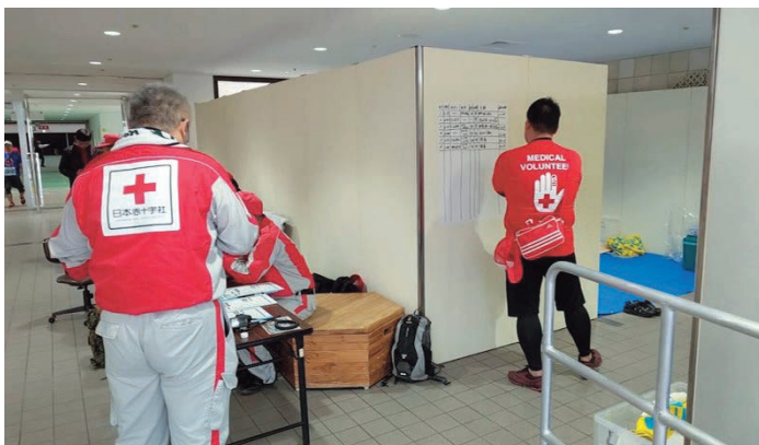
写真3 ドーム内の救護所での様子①