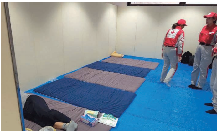
写真4 ドーム内の救護所での様子②