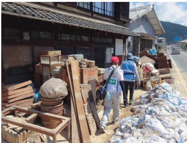
家財が出されている様子