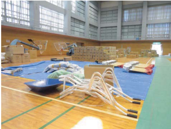
避難所に寄せられた物品