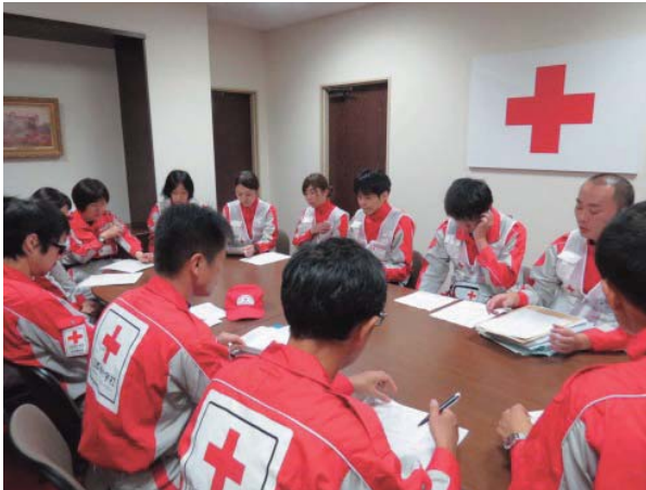
富山県救護班からの引き継ぎ