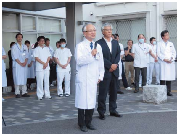
出発式での院長挨拶

午前11時前に安浦まちづくりセンターに到着し、センターの館長に活動の挨拶を行い、その後、避難所のアセスメントを実施した。同時刻、救護所の立ち上げを行い12時より診療を開始し