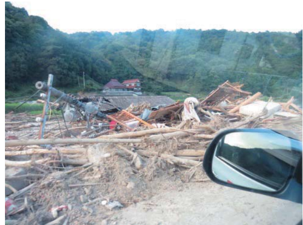
巡回中の山間部の様子