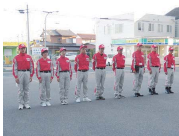
出発式での救護班員