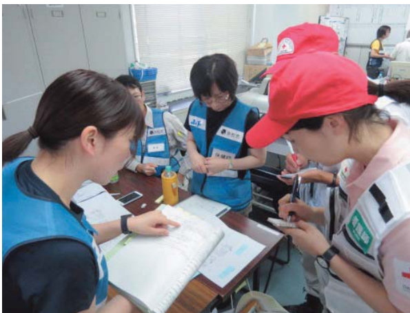
巡回診療に係る保健師と打合せ