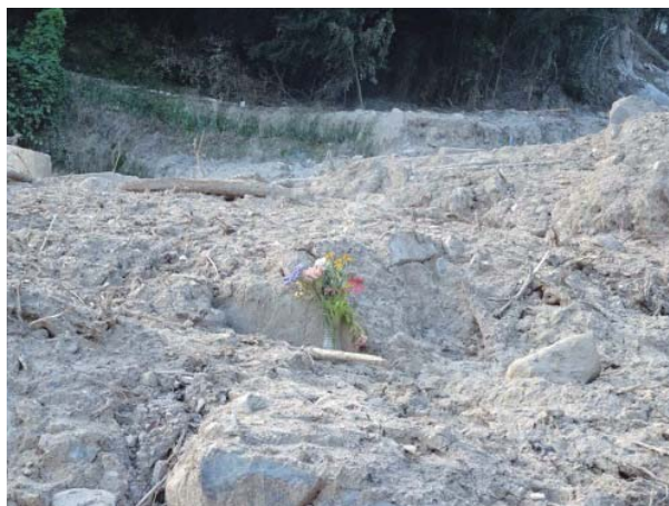
被災地に手向けられた花