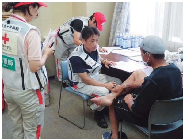
避難所救護所での診療の様子