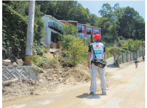
被災地を巡回する看護師