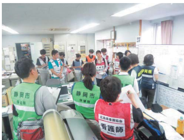
避難所でのミーティングの様子