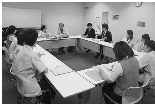
図3 認知症ケア委員会

定期的開催（スタート時には月に1回、その後は2-3か月に1回）し、認知症患者の入院環境を少しでも良くするようにそれぞれの職種が知恵を絞っている（図3）。平成26年から認知症看護認定看護師を中心にスタートしていた院内デイケアについても運営に関与することになった 4) 。