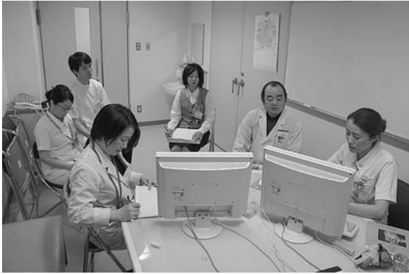
図5 認知症ケアカンファレンス