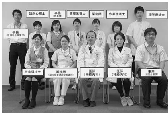
図2 認知症ケアチームメンバー

方法のアドバイス、院内デイケア活動の実質的な運営、ラウンドの記録確認、病棟の認知症リンクナースの育成、リンクナースとの情報共有などを行っている。社会福祉士は環境や家族背景の把握（家族の介護への協力体制を図る）、退院支援（退院後の社会資源の活用提案）、退院調整（転院・施設入所など）を行っている。薬剤師はせん妄リスクのある薬剤のスクリーニングを行い、適切な睡眠薬の選択（不眠症のタイプに応じた眠剤の使用）の推奨（ベンゾジアゼピンが不必要に使用されていないか）、過度な鎮静剤の使用はないか確認を行っている。理学・作業療法士はリハビリテーションの状況報告と離床に関するアドバイス、必要時に長谷川式簡易知能スケール（HDS-R）を実施している。臨床心理士はカウンセリングによる精神的サポート（回想法、現実見当識の強化）、家族へのサポートのアドバイス、必要時 HDS-R を実施している。事務は事務局として認知症ケアチームの運営を行い、病院内での折衝（院内デイケアの場所の確保）、保険点数のチェックなどを行っている。栄養士は認知症による食事・栄養のアドバイス、食事形態（ゲル食・あんかけ食など）のアドバイスを行っている。そして全てのメンバーが必要・可能時に院内デイケアのサポートを行っている 4) 。