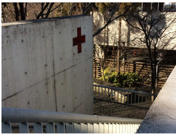
姫路赤十字病院（555床）：土地が広く、羨ましいですが、職員は「狭くてぎゅうぎゅう詰め」と。