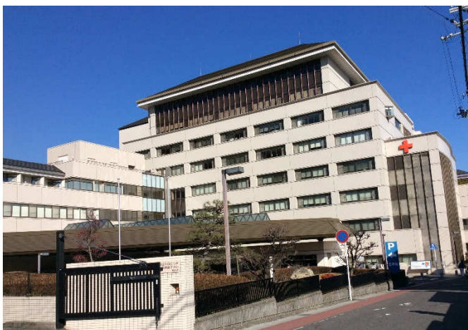
大津赤十字病院（781床）：最上階は会議室。