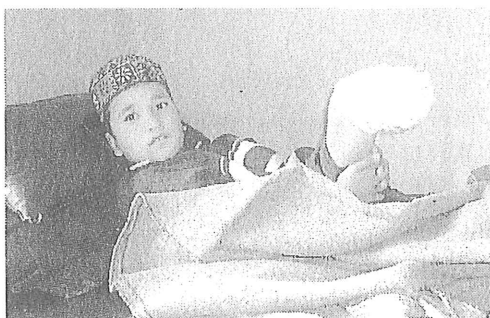
図1 地雷で足を奪われた。