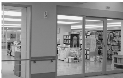
なるほどライブラリ入口