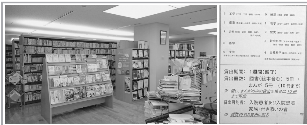
分かりやすい医学書展示書架と開架書架