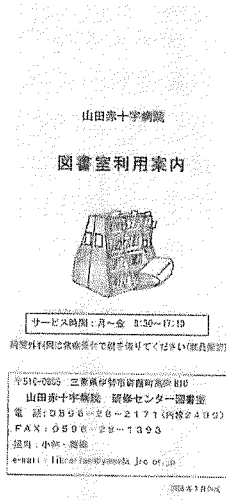
図1 図書室利用案内

入職時研修プログラムの内容として位置づけ、「図書室利用案内」(図1)にそって説明