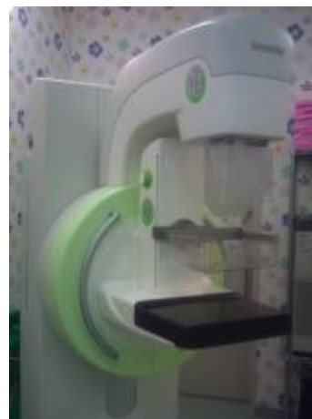
写真2 SIEMENS 社製 Mammomat Inspiration