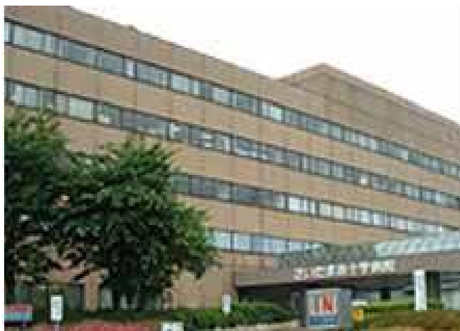
写真1 さいたま赤十字病院正面

放射線科部の診療放射線技師は常勤29名。乳腺外科には常勤医が3名、放射線科常勤医3名。乳癌手術は毎年約200症例、マンモグラフィ検査数としては2012年では3460件であった。近年中にさいたま新都心へ新築移転が決定されており、現在移転へ向けての準備段階である。