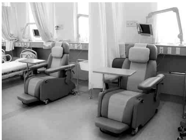
図1 化学療法センター：外来化学療法センターは中央処置室内に設置され、ベッド7床、リクライニングチェア4床が置かれている。