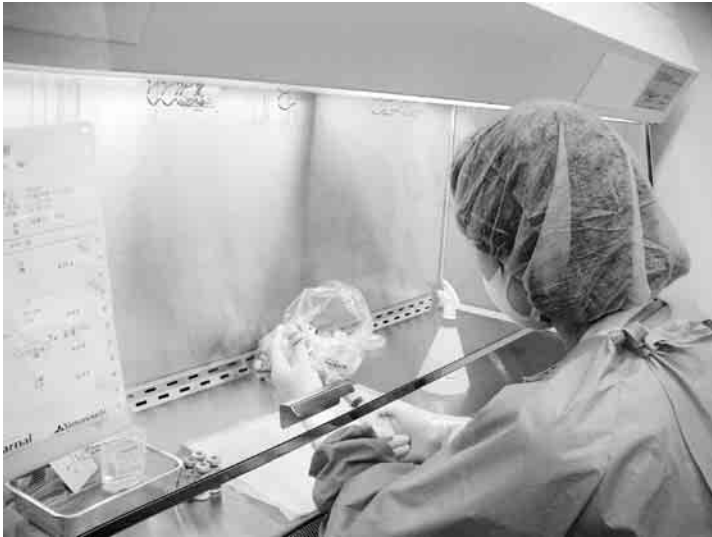
図3 安全キャビネット内での抗がん剤の調整：抗がん剤の調整は専門薬剤師が医療従事者や環境へ汚染しないよう安全キャビネット内で行っている。自身への被爆も避けるため、ガウン、ゴーグル、手袋などを着けている。

調整された抗がん剤は専用容器にて薬剤部から外来化学療法センターに運搬される。当番医師が看護師と一緒に薬剤の最終確認を行った後、薬剤の投与を開始する。薬剤投与開始後は、認定看護師がバイタルサインに変化はないか、静脈ライン穿刺部位に異常はないか、点滴の速度などを確認する。薬剤師や看護師によりきめこまやかな患者指導が行われる。