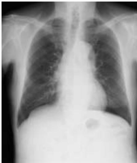
図1 術前X-P 心胸郭比の拡大を認めている