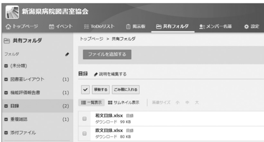
図2 クラウド管理による所蔵雑誌合同目録

ジャーナルを導入しているかが分かるので、相互貸借にも活用できます。また新しく導入を検討する際には、すでに導入している施設の具体的な利用状況なども調べやすいです。