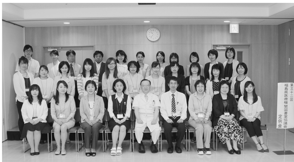
図2 第32回福島県医療機関図書室協議会定例会

急速な時代の流れと共に進むインターネットでの情報共有や、雑誌の電子化など、図書担当者に求められるスキルは多岐にわたりますが、少しでも図書室が医療の進歩に貢献できるよう、今後も努めていきたいと思っております。